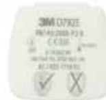
D7925 P2 R