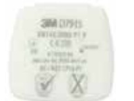
D7915 P1 R