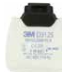
D3125 P2 R