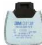
D3128 P2 R mit Aktivkohle