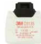
D3135 P3 R