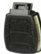
D8094 ABEK P3 R