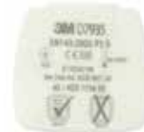
D7935 P3 R