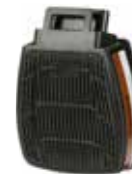
D8095 A2 P3 R