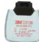
D3138 P3 R mit Aktivkohle